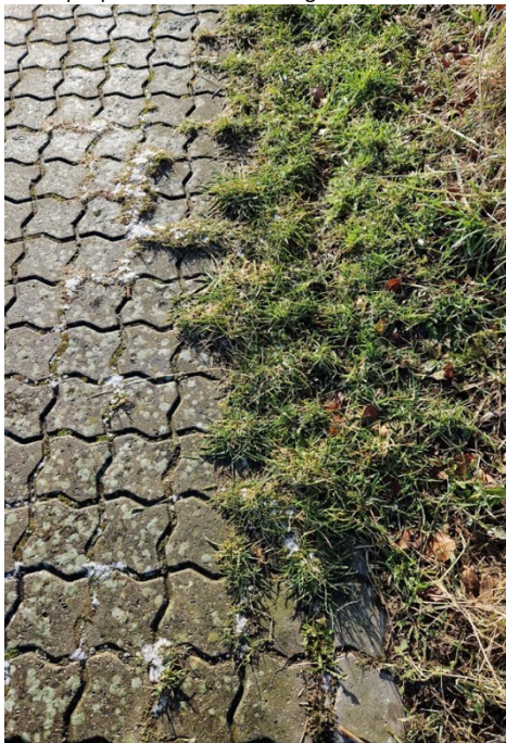
Eksempel på uønsket bevoksning

Haveudvalget har udarbejdet en standard, som ovenstående vil tage udgangspunkt i